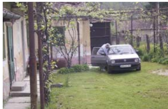
Hof des Gästehauses in Nou Sasesc