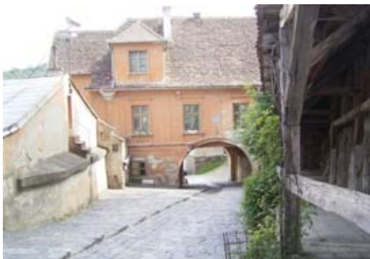
Altstadt vom Sigisoara

Ehepaar zum Essen im Gasthaus ein. Sie Schweizerin, er Deutscher leben mit ihren Kindern in einem abgelegenen Dorf Nou Sasesc (Neudorf) und betreiben eine kleine Landwirtschaft. Untergebracht sind wir in einem ehemaligen Bauernhaus, das von Schweizern zu Freizeitzwecken ausgebaut wurde.