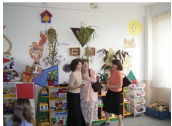
Das „Innenleben“ der Schule