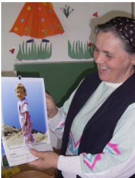
Die Kindergartenleiterin freut sich über die mitgebrachten Kalender

Die Erzieherinnen, die Helferin und der Pastor erwarten uns mit offenen Armen. Die Freude ist übergroß, als wir uns nach zwei Jahren wieder treffen und es gibt vieles zu erzählen. Auch hier, sowie in allen anderen Kindergärten die wir noch aufsuchen, überreichen wir für die Kinder Süßigkeiten und Kalender. Und es ist für die Erzieherinnen wie ein Geschenk des Himmels für den bevorstehenden Tag des Kindes (1.Juni).