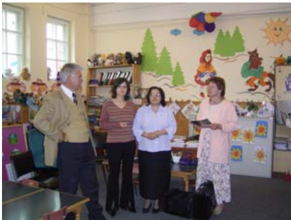
Gruppenraum in Suceava