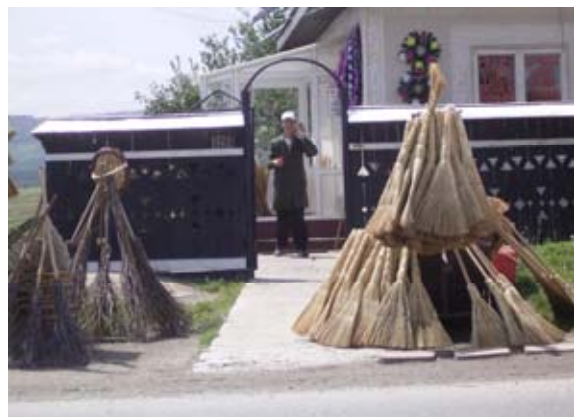
Straßenbesen zu Verkaufen

Der Großteil der Bevölkerung kann damit nicht Schritt halten und die Kluft zwischen Arm und Reich wird immer größer. Doch das Verlangen nach Geld und Ansehen ist geweckt und bedeckt das Land wie ein unsichtbarer Fluch, dem sich die Menschen kaum entziehen können. 20 % der Bevölkerung Rumäniens arbeitet inzwischen im Ausland. Viele davon illegal. Meist sind es junge Menschen, die nach der Berufsausbildung das Land verlassen, weil sie keine Perspektive vor sich sehen. Oftmals