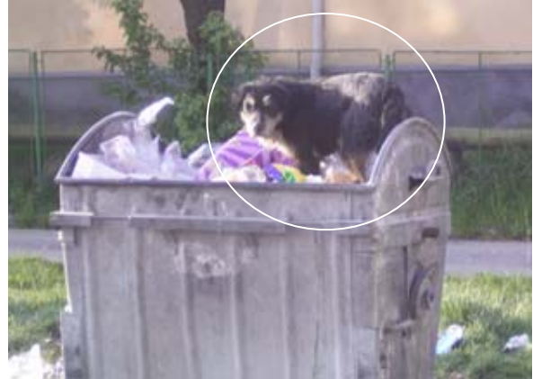
Straßenhunde wühlen im Abfall

Die Nächte in dieser Gegend sind äußerst abwechslungsreich und spannend. Wie nirgendwo sonst in dieser Intensität gibt es hier massenweise streunende Straßenhunde, die nachts bellend, jaulend und wie Wölfe heulend durch die Straßen ziehen. Hmh, mit Ohropax könnte man hier sicherlich haufenweise Geld verdienen. Man sagte uns, dass inzwischen alle Hunde sterilisiert wären. Aber bis diese ausgestorben sind gehen noch einige Jahre ins Land.