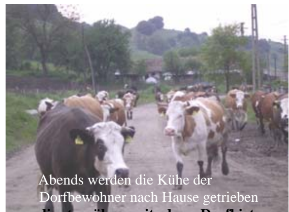
Abends werden die Kühe der Dorfbewohner nach Hause getrieben die tagsüber mit dem Dorfhirten auf der Weide waren.