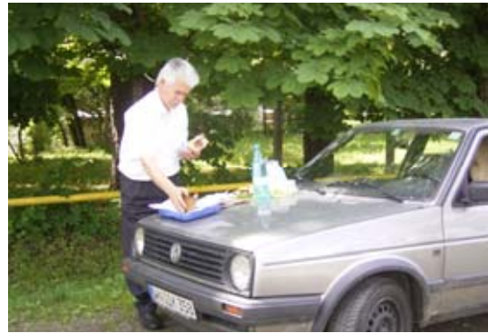
Improvisation bei der Essensrast

Unser Weg führt über Cluj, wo wir im Samariteanul (unsere ehemalige Missionszentrale) einen Überraschungsbesuch abstatten. Die Freude ist derart groß, dass wir von den Mitarbeitern fast erdrückt werden und kurz vor einem Rippenbruch stehen!?