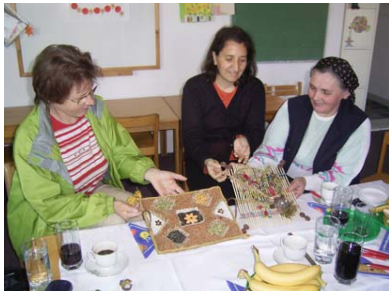
Als die Erzieherinnen gestern von unserem Besuch erfuhren, bastelten sie die ganze Nacht, um uns eine Überraschung machen zu können