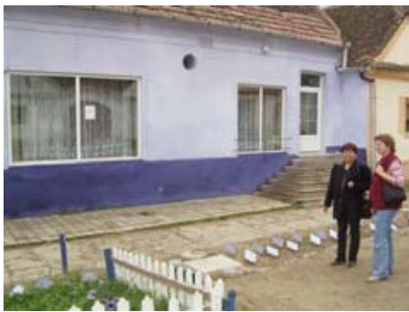
Der mögliche neue Verkaufsraum in Laslea

Ehe wir in unser Nachtquartier zurückkehren, machen wir einen Abstecher in Malemkrug, einer typischen Ortschaft der Siebenbürger Sachsen, die mit Unterstützung von Prinz Charles restauriert werden soll, um als Kulturerbe erhalten zu werden. Uns erwartet eine idyllische Ortschaft am Ende der Welt. Heute leben in der ehemaligen rein deutschen Ortschaft nur noch 100 Deutsche, meist ältere Menschen.