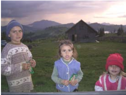
Unterwegs halten wir gelegentlich und Verteilen 'Süßigkeiten an Kinder

Weiter geht es nach Bistrita, wo wir unser Nachtquartier in der Baptistengemeinde bekommen sollen. Vor uns liegen 300 km Bundesstraße. Aber an ein schnelles Vorwärtskommen ist nicht zu denken. Durch den kalten Frühling und den anhaltenden Dauerregen sind die Straßen dermaßen kaputt, dass wir für die letzten 100 km geschlagene drei Stunden brauchen. Mit einem Durchschnitt von 35 km hoppeln wir im Zickzack über die Straße. Es ist nicht die Frage ob wir ein Loch treffen, sondern welches Loch und wie tief es sich im letzten Augenblick herausstellt. Kritisch wird es, als in der inzwischen einbrechenden Dunkelheit Regen einsetzt und Gegenlicht und unbeleuchtete Fahrwerke das Fahren zu einem gefährvollen Unternehmen machen. Wie dankbar sind wir, als wir trotzdem bewahrt und ohne Panne (Empfehlung eines Pastors: bewahrt das Reserverad immer griffbereit auf) unseren Zielort erreichen.