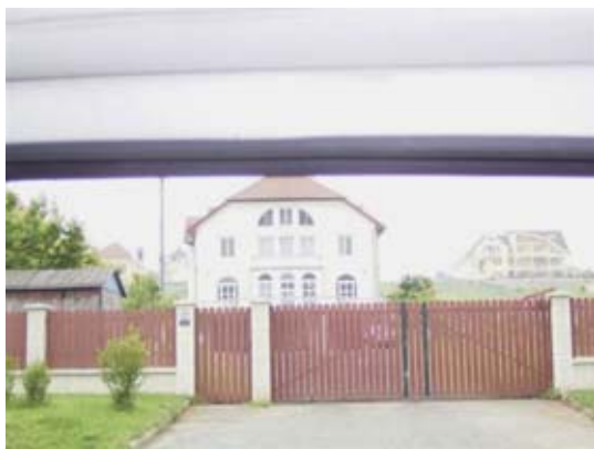
Villen der Neureichen säumen die Straße

Weiter geht die Fahrt auf überraschend gut ausgebauten Straßen in die Moldau bis nach Pascani. Wir durchqueren Bacau und Roman und sind erstaunt über den wirtschaftlichen Aufschwung dieser Städte. Noch nie zuvor ist es uns so aufgefallen wie in diesem Jahr. Und die Neureichen wissen sich zu präsentieren. Teure Autos und elegante Villen in großen Vorgärten, die sichtbar entlang der Bundesstraße gebaut wurden, säumen die Bundesstraße. Man weiß sich zur Schau zu stellen.