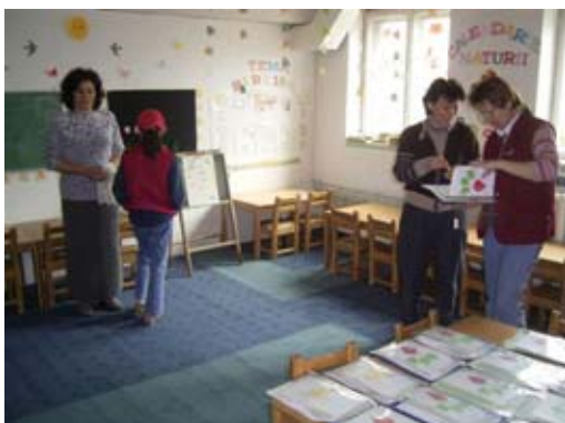
Kindergarten von Huedin

Weiter geht die Reise über Huedin und Alesd, wo wir weitere Kindergärten besuchen und mit Begeisterung empfangen werden. Traurig stimmt uns die Tatsache, dass einige ehemaligen, nördliche Kindergärten kurz vor der Schließung stehen, da kaum finanzielle Unterstützung vom Ausland kommt und sie sich nicht mehr tragen können. Es tut in unserem Herzen weh und wir wünschen und beten darum, dass es zu einer Wiedervereinigung kommt.