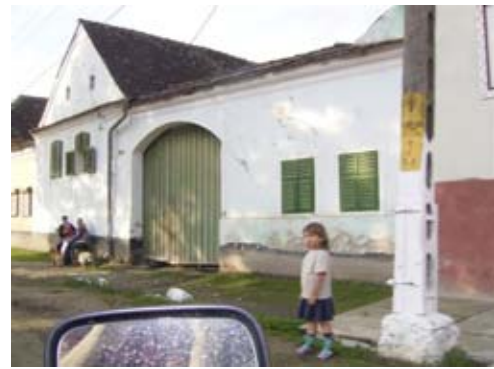
Dortkulisse von Malemkrug