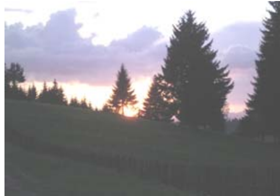
Bei der anstrengenden Fahrt werden wir durch eine bezaubernde Landschaft belohnt