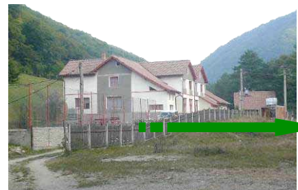
Schon im Vorfeld der Schulung gab

es viele Hindernisse zu überwinden. Ich möchte Gott danken, dass er mitten in den Schwierigkeiten Ruhe und Gelassenheit geschenkt hat und uns bewusst war: er wird's wohl machen. Und er hat es wohl gemacht.